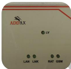
Таблица 7 - Индикация событий